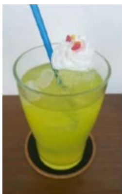
ピーターのエナジーサマードリンク

URL： http://www.machiasobi.com/machiasobicafe/index.html