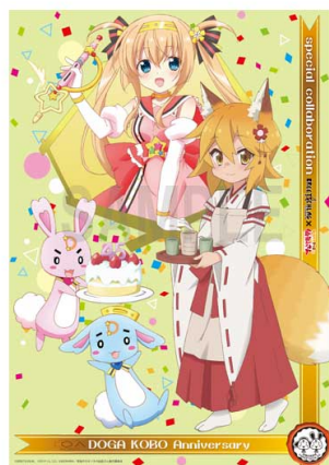
動画工房Anniversaryシリーズ vol.3 コラボレーションクリアポスター (A3) 1500円 (税抜)

©BREETSCHLAG ©2019 リムコロ/KADOKAWA/世話やきキツネの仙狐さん製作委員会