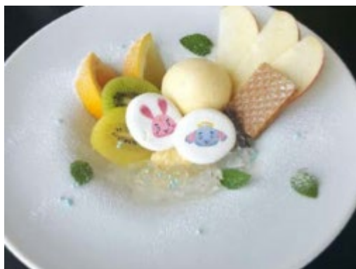
ピーター&ペペのキャンパスフルーツアソート