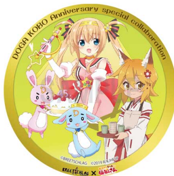
動画工房Anniversaryシリーズ vol.3 コラボレーション缶バッジ (76mm) 700円 (税抜)