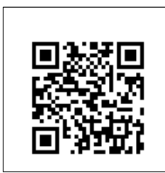
↑ 「BREETSCHLAG」公式 HP QR コード